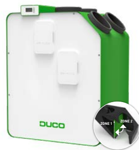
DucoBox Energy Premium 2 zones – dag / nacht

Mechanische ventilatie met warmteterugwinning