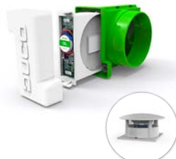
Intelli Air Valve Onbeperkte zones gecombineerd met RoofFan