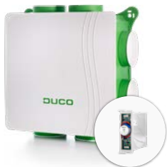
DucoBox Focus Tot 11 zones