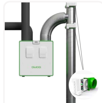
Meerzoneklep 2 zones – dag / nacht in combinatie met DucoBox Energy Comfort (Plus)