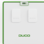
Comfort Plus 350/450/550